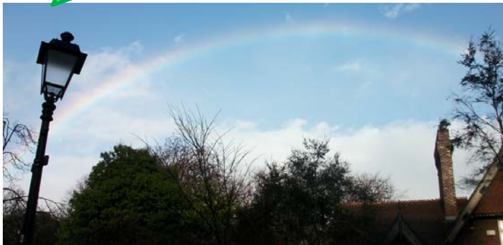
AHK | Dublin, Irland