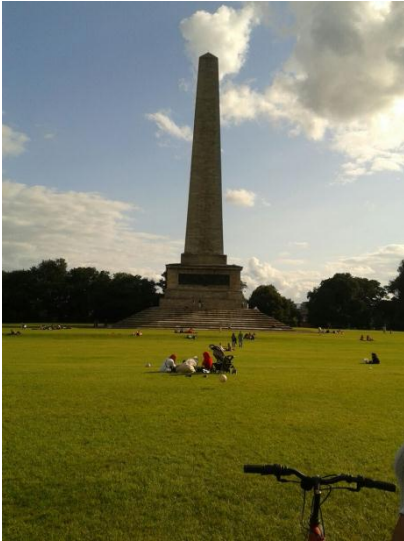
Der Phoenix Park